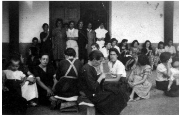
(Patio de Mujeres de la Cárcel de Sevilla)

En Granada, en el convento de San Gregorio, próximo a la Calderería, estuvo la cárcel de mujeres. Antiguo convento que fue restaurado en 1936 y dedicado a tal fin; dicha institución estuvo vigilada por los temidos “mangas verdes” que actuaban en Granada. De este lugar salieron muchas mujeres para el Gobierno Civil y de éste, a correr la misma suerte que tantos hombres, unas en las tapias del Cementerio de San José, y, otras, al barranco de Viznar