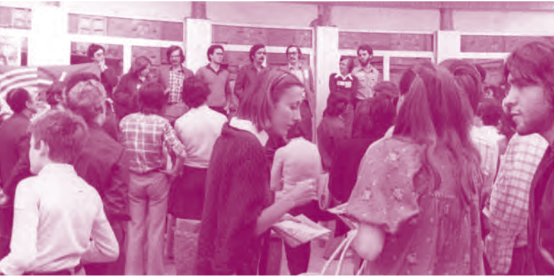
Repartiendo panfletos. Cine Marítimo, Valencia

Y si tuviera que definir mi inicio en el feminismo en general y en salud en particular, diría que he sido y creo sigo siendo una mujer que ante una reivindicación me pongo manos a la obra para resolverla y durante el trayecto voy reflexionando sobre ello. Podríamos decir que el método ha sido acción- reflexión.