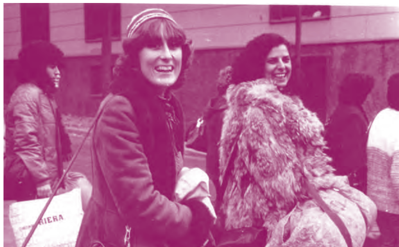
Jornadas de Granada, con Carmen Alborch

Nunca he dejado de ser de donde soy -del movimiento feminista- incluso en momentos difíciles