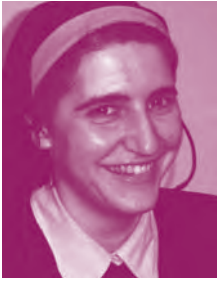
Teresa Forcades i Vila