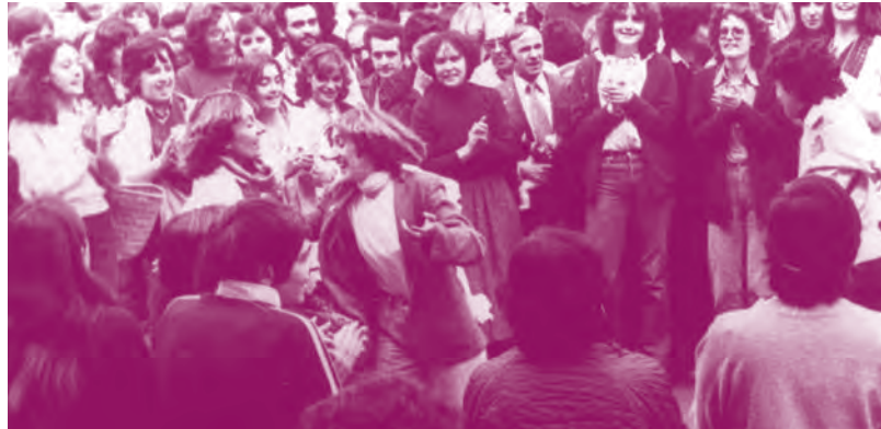
Manifestación en el Arzobispado